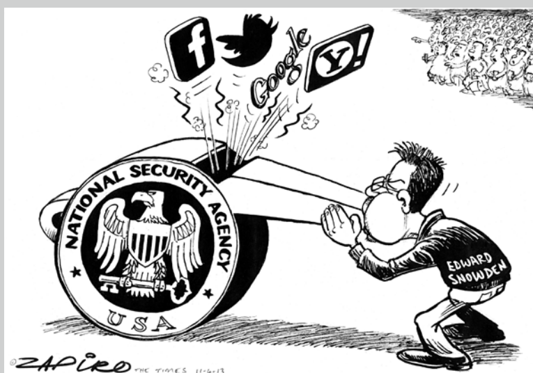
Zapiro: Edward Snowden: the man who blew the whistle, erschienen in: The Times, 11.6.2013.

Edward Snowdens «Manifest für die Wahrheit» vom 1. November 2013. Erstmals publiziert im Spiegel, 45 (2013), http://original.antiwar.com/edward-snoden/2013/11/03/a-manifesto-for-the-truth , Stand: 31.7.2014.